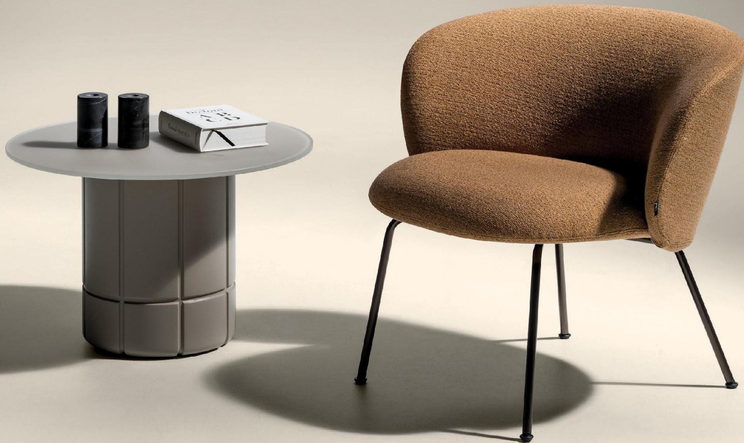
COLOMBINA ARMCHAIR - Somme L111 fabric. Peltro steel legs. ALBERONI COFFEE TABLE - Tortora matt glass top. Tortora lacquer base.