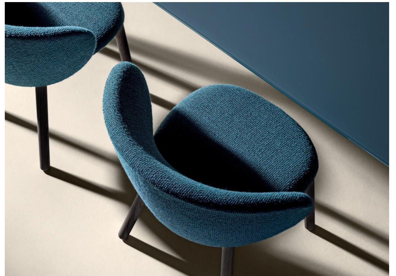
W 58 cm / D 60 cm / H 78 cm