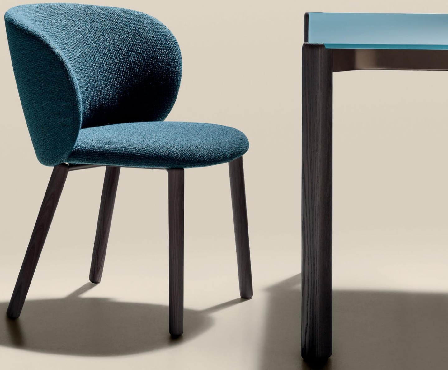
COLOMBINA CHAIR - Somme S113 fabric. Finewood nero legs.