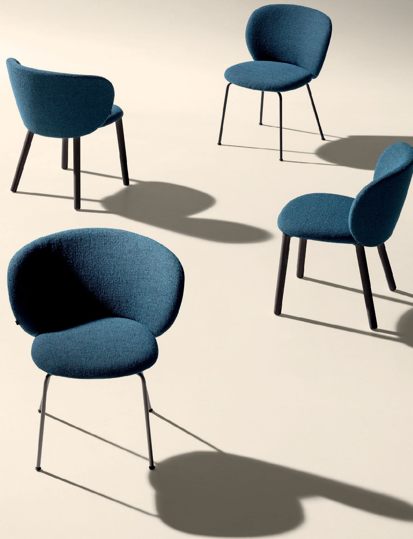
COLOMBINA CHAIR - Somme S113 fabric. Finewood nero legs. COLOMBINA DINING CHAIR - Somme S113 fabric. Finewood nero legs. COLOMBINA CHAIR - Somme S113 fabric. Titanio steel legs. COLOMBINA DINING CHAIR - Somme S113 fabric. Titanio steel legs.